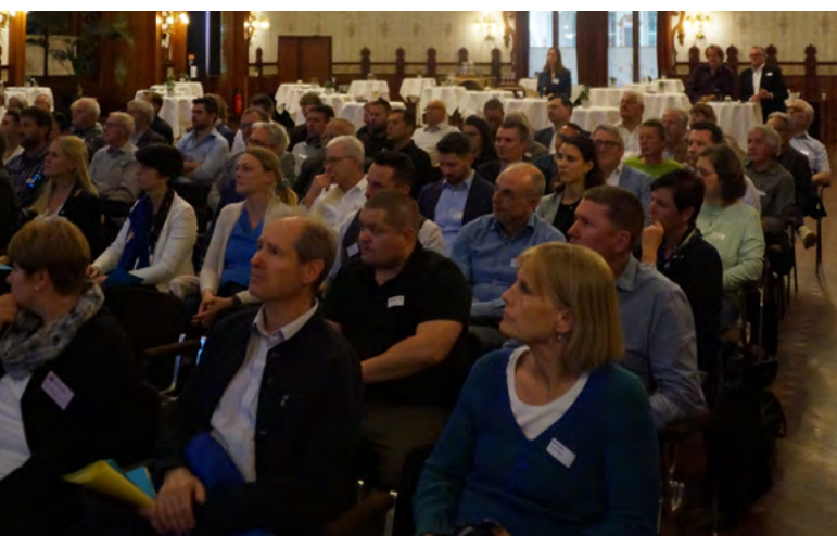
Das Publikum an der 103. Generalversammlung im Kursaal Interlaken.