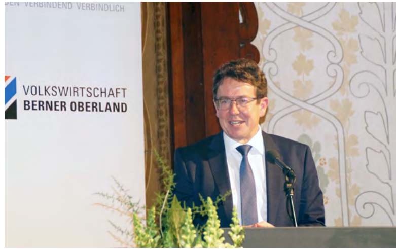
Bundesrat Albert Rösti wurde an der 103. Generalversammlung der Volkswirtschaft Berner Oberland zum Ehrenmitglied ernannt.