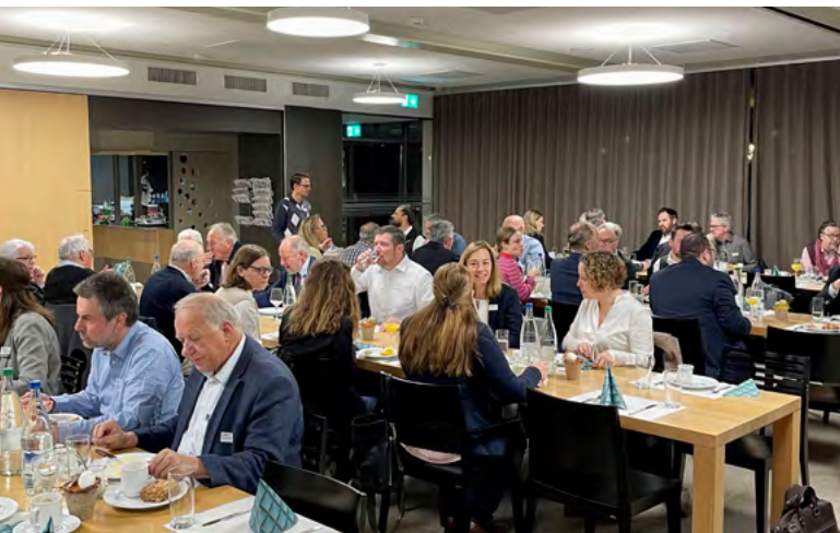
Networking am frühen Morgen: Teilnehmerinnen und Teilnehmer am Wirtschaftsbusinessbrunch in Steffisburg.