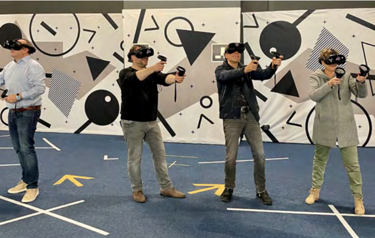
Virtuell unterwegs: Zu Besuch bei der Virtual Discovery AG, Interlaken.