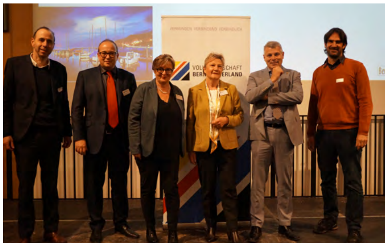
Gruppenfoto mit den Referenten des Wirtschaftstreffens und den Verantwortlichen der Volkswirtschaft Berner Oberland.