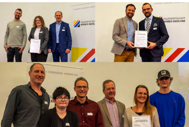
Die Siegerprojekte der Innovationspreise Berner Oberland: Payrex QR-Pay, Thun (oben links), Seewasser Wärmepumpe, Hotel Beatus Merligen (oben rechts) und der Verein WG Mischer aus dem Saanenland (unten).

Der Verein WG Mischer hat es sich zum Ziel gesetzt, junge Menschen ins Saanenland zu holen. Dank der Wohngemeinschaft Mischer im ehemaligen Wohnheim Rübeldorf in Saanen finden junge Menschen, die in der Region eine Berufslehre absolvieren, ins Berufsleben einsteigen oder das Gymnasium besuchen, eine bezahlbare Unterkunft mit sozialen Strukturen.