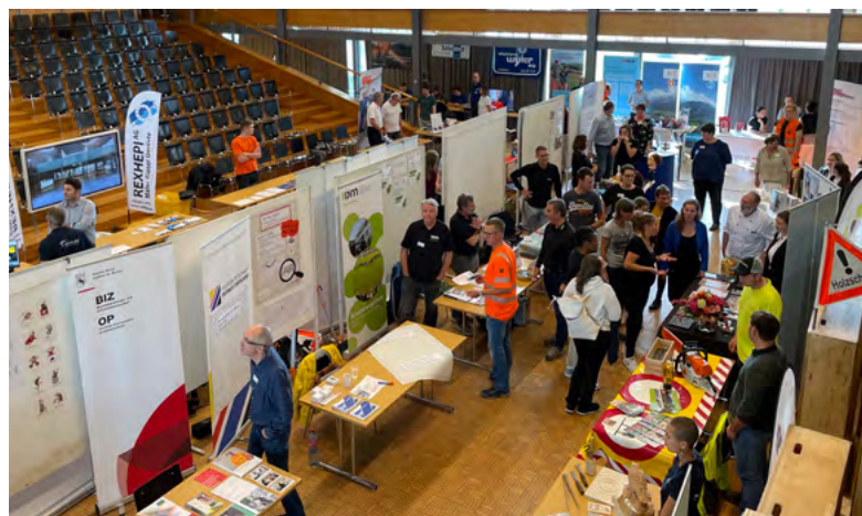
Lehrstellenbörse «Fit for Jobs» in der Aula in Interlaken.

Im Berichtsjahr konnte das grosse und anforderungsreiche Projekt einer digitalen Plattform rund um Lehrstellen, kurz «Lehre BeO», erfolgreich abgeschlossen werden. Die Lehrstellenplattform zeichnet sich mit einer übersichtlichen Karte aus, auf der Jugendliche sich durch das Berner Oberland bewegen und spielerisch Betriebe erkunden und entdecken können. Mit «Lehre BeO» ist Vernetzung für Lehrbetriebe, Lernende, Schulen und Unternehmen in einer neuen Qualität möglich.