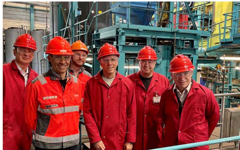
Eine Delegation zu Gast bei der BATREC Industrie AG in Wimmis.