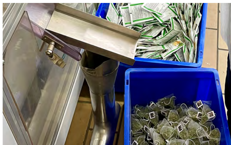
Die SAH Alpenkräuter AG in Därstetten stellt seit über 30 Jahren Kräuterspezialitäten her.