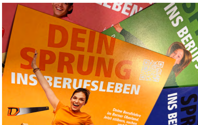
Auftritt Lehrstellenplattform «Lehre BeO».