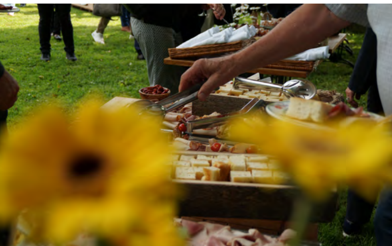
Networking und Apéro im Freien: Tourismusforum Berner Oberland.