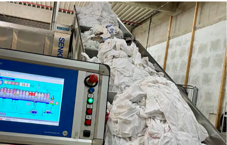
Ein Augenschein bei der Wäsche-Perle AG Interlaken.